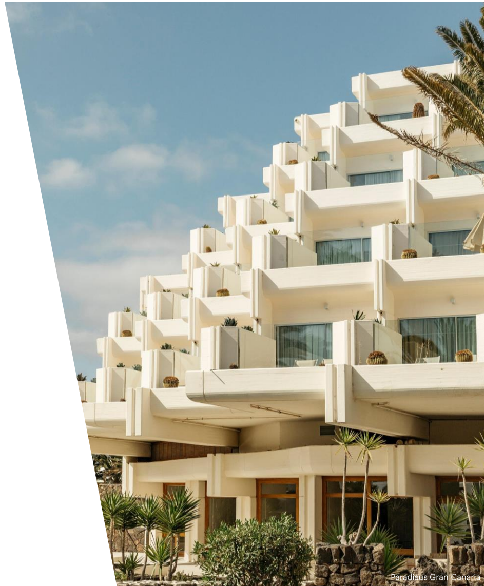
Paradisus Gran Canaria