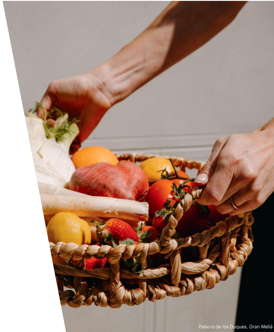
Palacio de los Duques, Gran Meliá

Seleccionamos a nuestros proveedores no solo en base a criterios técnicos, de calidad y económicos, sino también sostenibles. Además, buscamos la complicitad y alianzas con nuestros proveedores para fortalecer un compromiso compartido por la sostenibilidad.