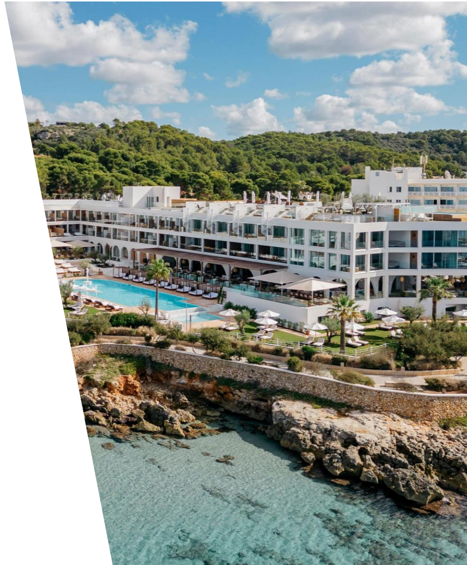
Villa Le Blanc, Gran Meliá (Menorca, España)

Por ello, nuestro compromiso con el medioambiente nos exige que los procesos de diseño, construcción o mantenimiento de nuestros hoteles sean cada vez más eficientes y sostenibles, y aprovechamos los proyectos de reforma para introducir mejoras que nos permitan minimizar nuestra huella y ser más respetuosos con nuestro entorno.