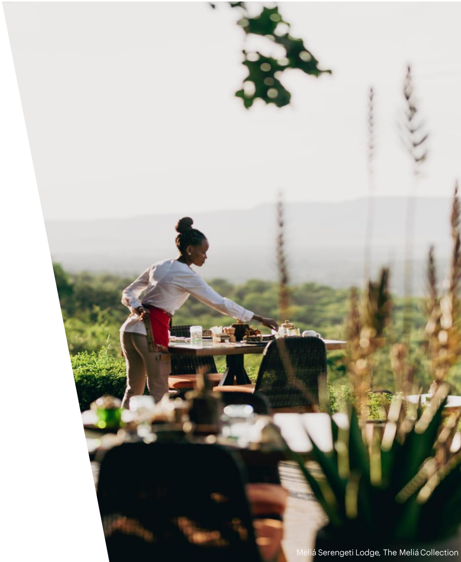
Meliá Serengeti Lodge, The Meliá Collection

Además, desde 2018, incentivamos su defensa y protección en nuestra cadena de suministro para avanzar juntos hacia una sociedad más justa.