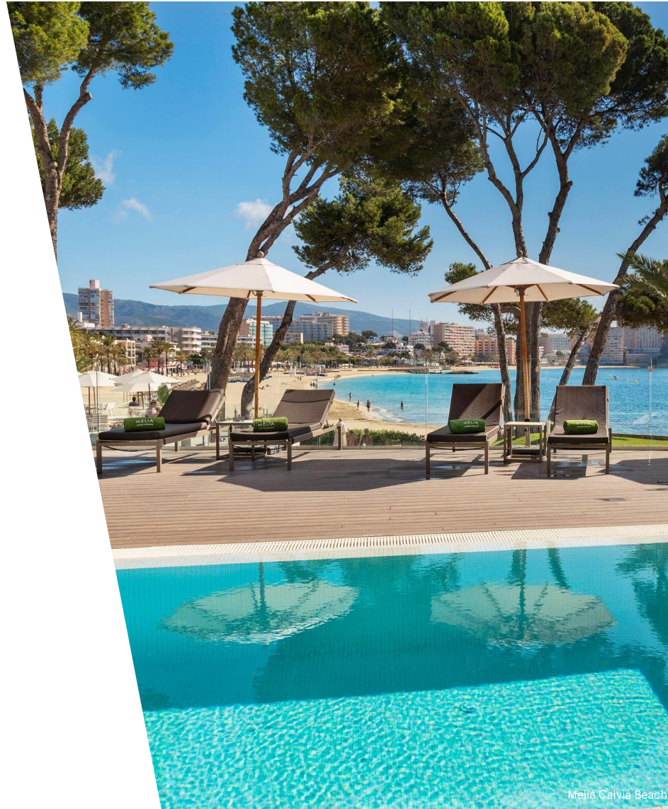
Meliá Calviá Beach

Creemos que la cooperación con el sector público es necesaria para rediseñar la industria turística en clave sostenible tras la grave crisis del Covid-19, así como para mejorar la competitividad de los destinos turísticos. Por ello, participamos activamente en entidades e instituciones de diversos ámbitos para fortalecer nuestros compromisos públicos.